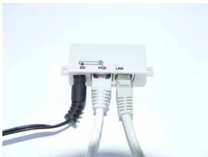
4. U utičnicu LAN se povezuje kabl za kompjuter