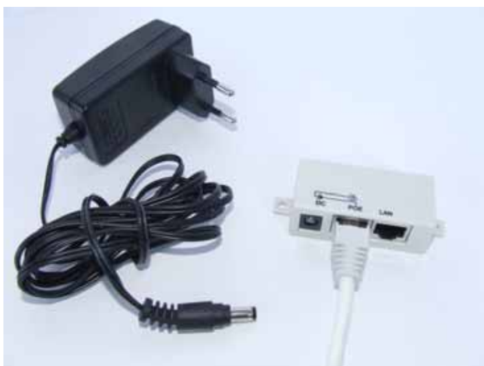
3. Povezivanje AC/DC adaptera sa POE adapterom