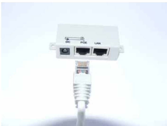
1. POE adapter