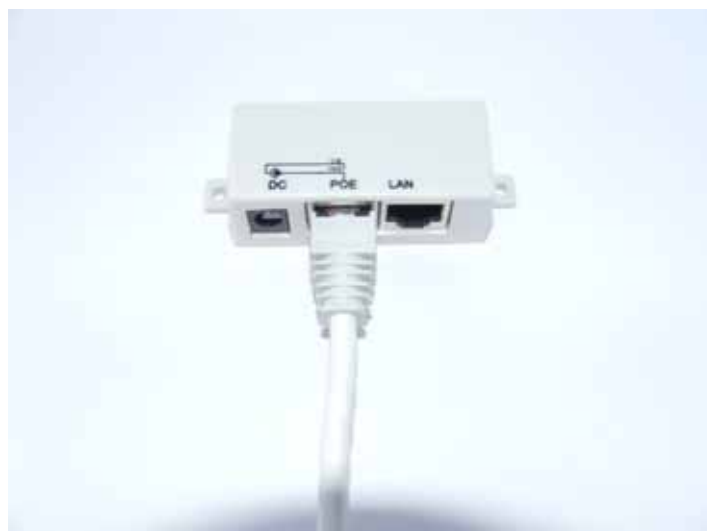
2. Povezivanje UTP kabla koji dolazi od uređaja sa krova